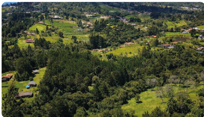
Corregimiento de Santa Elena (2023).

La información de flores exportadas y cultivadas de manera tradicional por los campesinos de Santa Elena deja una serie de interrogantes en torno a la manera cómo se producían dichas plantas ornamentales: Qué flores se cultivaban, qué técnicas se aplicaban, los cuidados culturales, el manejo fitosanitario, riego, fertilización, el corte, la postcosecha, comercialización, empaque, transporte, comportamiento y duración en florero, etc. éstos son elementos propios de un conocimiento práctico y profundo que merece ser estudiado y hacerse una investigación económica e histórica al respecto y concatenar esta información que nos orienta a pensar que la exportación de flores en Antioquia y posiblemente en el país, fue mucho anterior al surgimiento de la primera exportación de flores colombianas realizada por Edgar Wells y reportada en el año de 1965 26