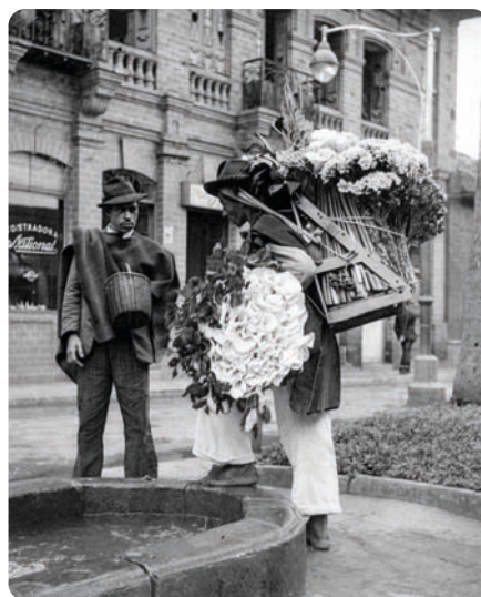
Silletero en la Plazuela de San Roque. (1955).

eran de dos pisos, que giraban alrededor de un patio central donde se