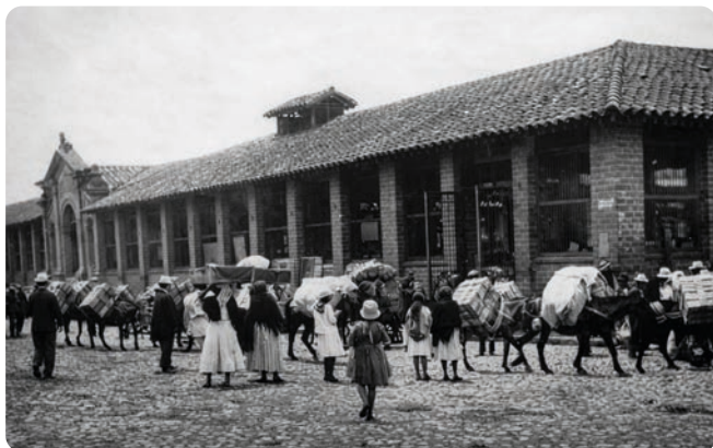
Mercado cubierto en la Plaza de Guayaquil en 1920 3 .

na es la base que va a dinamizar la fuerza del desfile de silleteros. En la actualidad existen diferentes categorías caracterizadas por el tipo de silleta: emblemática, artística, monumental, industrial y la tradicional, además de las categorías junior e infantil.