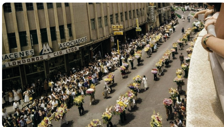
Silleteros en la Avenida 1° de mayo (1964).

Para mí ser floricultor es tener un tacto diferente de lo que son las plantas, de lo que es cuidarlas, ver su proceso desde que uno las siembra hasta que florecen y el fruto que son las flores. Es lo más maravilloso. Para mí es un estilo de vida; es la conexión con los recursos naturales y con todo lo que nos rodea 25 .